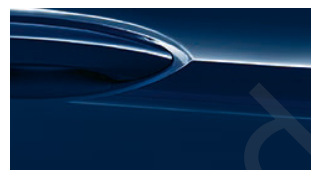
Außenfarbe Indigo Blau