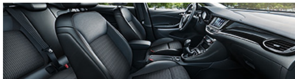
Stoff Athena/Premium-Lederoptik, Schwarz 1