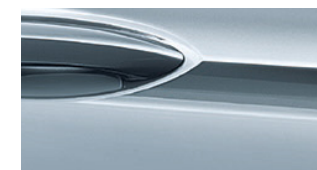
Außenfarbe Diamant Blau