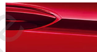
Außenfarbe Lava Rot