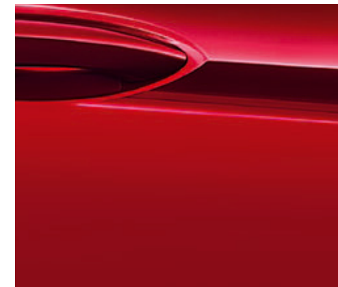
Außenfarbe Lava Rot