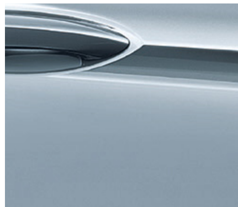
Außenfarbe Diamant Blau