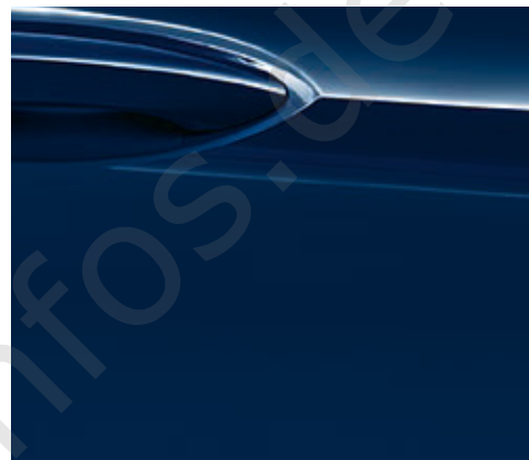
Außenfarbe Indigo Blau