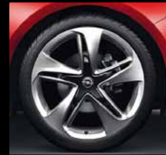
Leichtmetallrad 8 1/2 J x 20 im 5-Sternspeichen-Design, Reifen 245/40 R 20 (RQ9). Optional für Edition und INNOVATION.