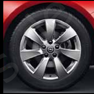
Leichtmetallrad 7 1/2 J x 18 im 7-Speichen-Design, Reifen 235/50 R 18 (RQK). Optional für Edition.