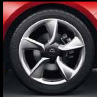
Leichtmetallrad 8 J x 19 im 5-Speichen-Design, Reifen 235/45 R 19 (RT8). Optional für Edition und INNOVATION.