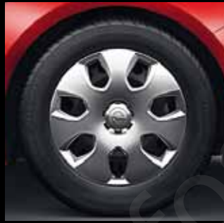
Stahlrad 7 J x 17 inkl. Abdeckung, Reifen 235/55 R 17 (PWP). Serie bei Edition.