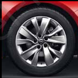
Leichtmetallrad 7 1/2 J x 18 im 5-Doppelspeichen-Design, Reifen 235/50 R 18 (RQH). Optional für Edition und INNOVATION.