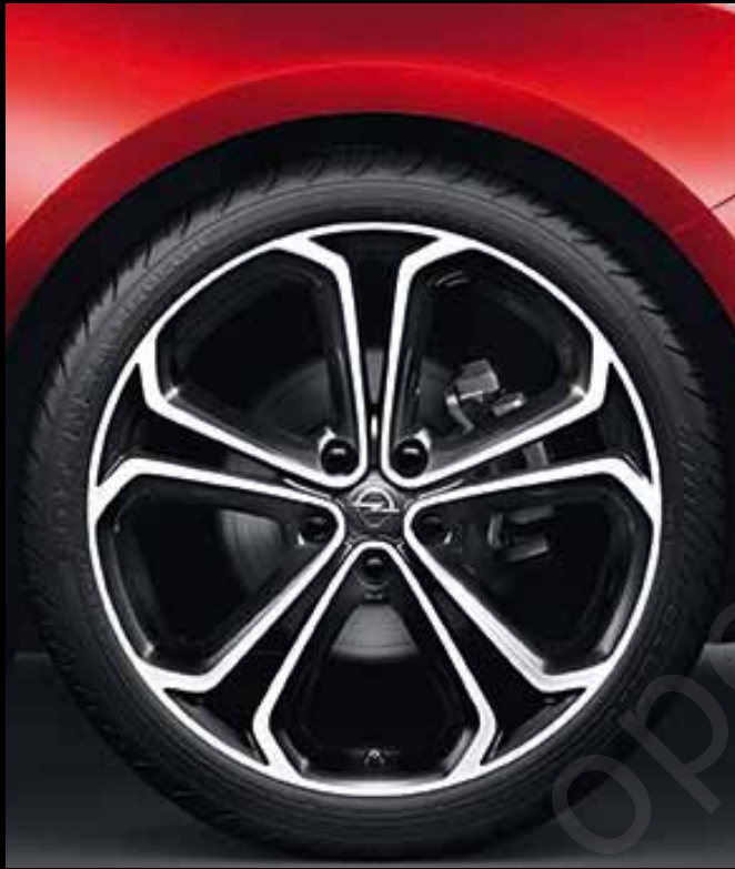
BiColor-Leichtmetallrad 8 1/2 J x 20 im 5-Doppelspeichen-Design, Reifen 245/40 R 20 (RQA). Optional für Edition und INNOVATION.

Vielfältiges Räderangebot für individuellen Auftritt. Mit Leichtmetallrädern bis zum 20-Zoll-Format wirkt der neue Opel GTC besonders spektakulär.