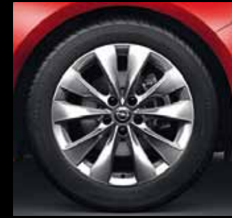
Leichtmetallrad 7 1/2 J x 18 im 10-Speichen-Design, Reifen 235/50 R 18 (RQJ). Serie bei INNOVATION.