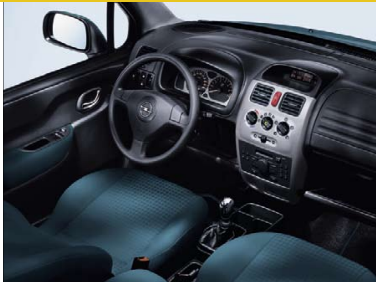
Abbildung zeigt Sonderausstattung.