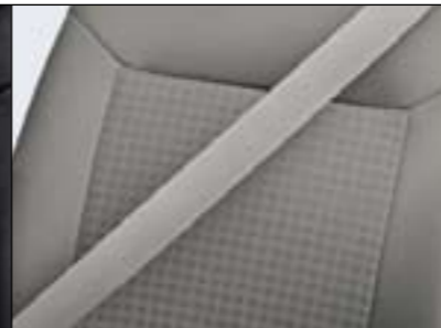
▲ Piazza/Elba, Silber