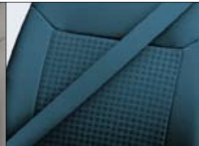
▲ Piazza/Elba, Petrolgrün