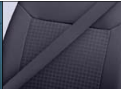
▲ Piazza/Elba, Flieder