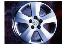
Leichtmetallräder der Dimension 161 x 41/21 im edlen 5-Speichen-Design.

Perfektes Handling in jeder Situation vermittelt das Interaktive Dynamische FahrSystem (IDS); ein aktives Sicherheitskonzept, das durch elektronisch unterstützte Kontrollsysteme optimalen Fahrbahnkontakt herstellt und exzellente Fahrdynamik garantiert. Entspanntes Reisen garantieren die Klimaanlage, individuell einstellbare Sitze für Fahrer und Beifahrer sowie das höhen- und längsverstellbare 4-Speichen-Lederlenkrad. Ganz ehrlich: Der Zeitpunkt zum Einstieg in die Dimension Vectra könnte nicht besser gewählt sein.