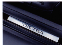
Glänzend: Einsteigsleisten in Chrom mit Vectra-Schriftzug.

Ausgereifte Technik, strengste Qualitäts- und Fertigungsstandards, ausgezeichnete Komfort, hervorragender Insassenschutz durch ein umfassendes Paket aktiver und passiver Sicherheit haben den Opel Vectra dauerhaft an der Spitze etabliert. Als meistverkaufte viertürige Limousine seiner Klasse wurde er klarer Testsieger und mit dem Goldenen Lenkrad 2002 belohnt. Agilität und Fahrspaß: Adäquaten Vortrieb offerieren Benzinmotoren mit 90 kW (122 PS) oder 108 kW (147 PS), Diesel mit 74 kW (100 PS) oder 92 kW (125 PS).