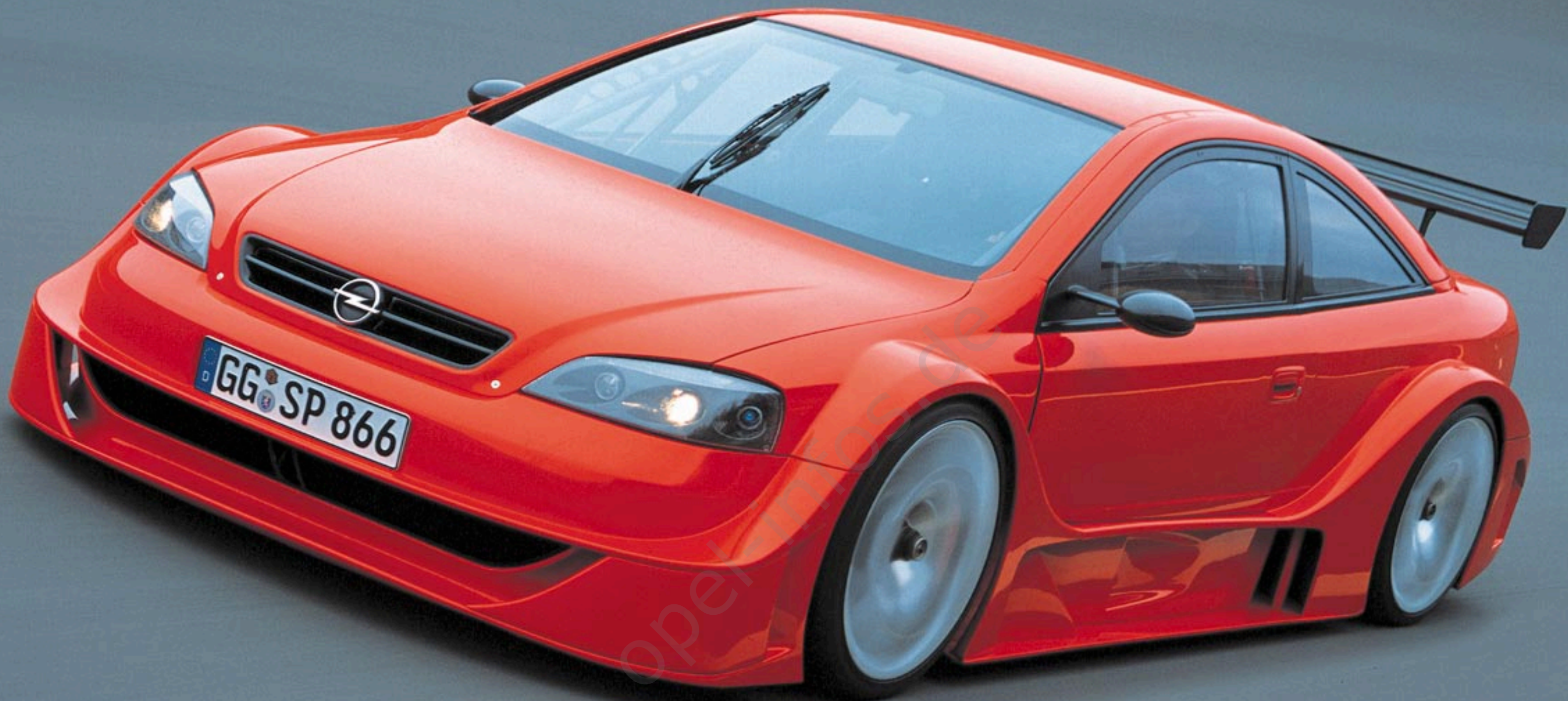
Astra OPC X-Treme