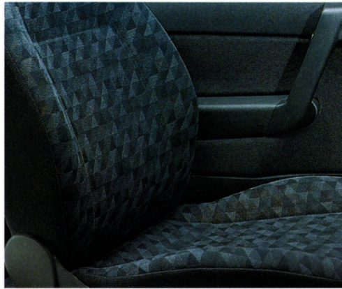
Zweck und Schönheit inklusive: Die Innenverkleidung in Linz schwarz ist strapazierfähig, pflegeleicht und immer ein erfreulicher Anblick.

Hier kommt die ideale Lösung für kleine und große Unternehmen: der Astra Lieferwagen. Außen ein kompakter Kombi, innen 1.600l Ladefreiheit. Egal welcher Berufszweig, egal welche Herausforderung oder Schwierigkeit, die Devise heißt stets: alles ist möglich. Flexibilität und Funktionalität bekommen einen neuen Sinn, Spaß an der Arbeit, einen neuen Namen: Astra Lieferwagen. Und selbst wenn Sie auf das Innere den größten Wert legen, tut es gut, auch durch Äußeres beeindruckend zu können. Und das beginnt schon beim Wagen, mit dem sie gut ankommen.