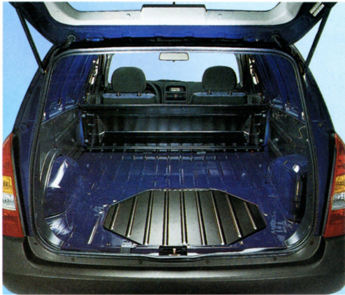
Eine große Ladefläche und einfaches Beladen - das zeichnet den Astra Lieferwagen aus (in Österreich serienmäßig mit Trenngitter).