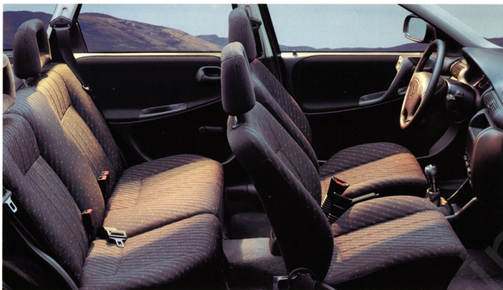
Elegancja, wygoda, praktyczność – klasyczne zalety Astry Classic.