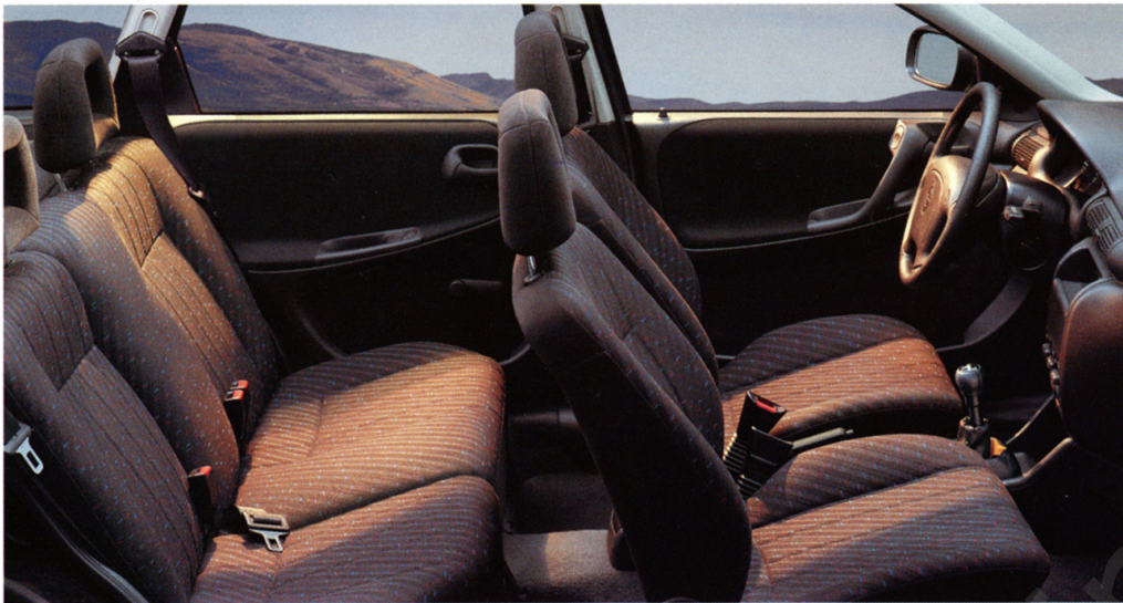
Elegancja, wygoda, praktyczność – klasyczne zalety Astry Classic.