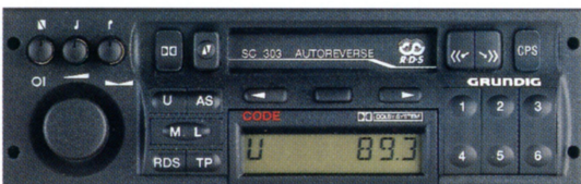
Radiokasettisoitin ja kuusi kaiutinta vakiona Vectra Meritissä.