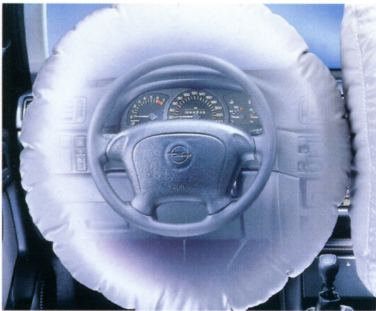
Vakiona oleva Vectra Meritin turvavyö on yksi markkinoiden suurimmista ja pehmeimmistä. Peräti 67-litrainen.