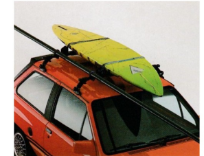
Surfboardträger, 1732281 , mit Kunststoff-Gummiprofil für Surfboardlagerung. Masthalterung mit Schnellverschluss. Nur in Verbindung mit Basisträger.