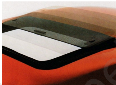
Sonnendach „Top-Slider“ , 1733005, mit ABE, völlig neue Konstruktion mit variablen Öffnungsmöglichkeiten. Stabil, robust und sicher. Zum stufenlosen Heben/Schieben bis über die Mitte der Dachöffnung. Einstellbar mittels versenkbarer Kurbel. Sonnendach „Top-Slider“, 1733006, (ohne Abb.), Komfortausführung mit elektrischem Öffnungsmechanismus.