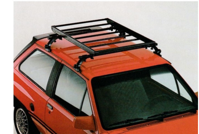
Dachgepäckträger-Galerie, 1732438 , kompaktes Trägersystem, 1020 x 800 mm. Nur in Verbindung mit Basisträger.