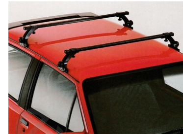
Basisträger, 1732421 , Grundträger für das gesamte Dachträgersystem, Tragkraft 75 kg.