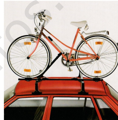
Der Fahrradträger , bestehend aus dem Basissatz, 1732454 , und dem Zubehörsatz, 1732555 , ist universell für alle Opel Modelle sowie für verschiedene Fahrradtypen und -größen verwendbar. Die Montage ist denkbar einfach: Das Fahrrad wird bereits auf dem Boden auf den Fahrradträger montiert und erst dann auf den Basisträger, 1732421, gehoben, der zuvor auf dem Wagen befestigt wurde. Praktische Schnellverschlüsse garantieren eine schnelle und sichere Montage. Die Zubehörsätze für Rennräder, 1732556, für Einzelradbefestigung, 1732558, und zur Diebstahlsicherung, 1732557, sind hier nicht abgebildet.