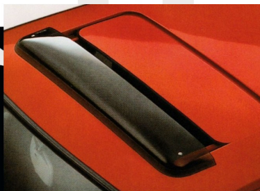
Dachwindabweiser, 1732119 , bietet Schutz und Sicherheit. Nur in Verbindung mit serienmäßig eingebautem Schiebedach.