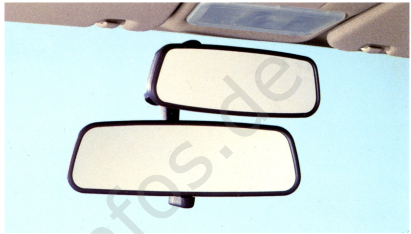
Links oben: Die Instrumententafel des Kadett und die Doppelbedienanlage. Sie ist auf Wunsch direkt ab Werk erhältlich. Rechts oben: Der Kadett ist auf Wunsch auch mit Anti-Blockier-System lieferbar. Eine weitere Steigerung der aktiven Sicherheit - bei einer Vollbremsung wird das Blockieren der Räder verhindert. Links unten: Die Sicherheitsgurte vorne und hinten sind höhenverstellbar. Rechts unten: Zweiter Innenspiegel für den Fahrlehrer.

Fahrschulspezifische Komplettausstattung direkt ab Werk. Der Kadett wird den hohen Anforderungen der Fahrschulpraxis gerecht. Einzeln oder als preiswertes Kadett-Fahrschulpaket sind ab Werk folgende Sonderausstattungen und Zusatzeinbauten erhältlich: Drehstromlichtmaschine mit höherer Leistung und/oder verstärkte Batterie, um die Stromversorgung bei erhöhtem Bedarf sicherzustellen. Vordersitzhöhenverstellung links für perfekte Sitzposition des Fahrschülers (serienmäßig bei GL und GLS). Damit der Anlasser durch versehentliches Betätigen bei laufendem Motor keinen Schaden nimmt, ist eine Anlaßwiederhol Sperre erhältlich. Für bessere Orientierung bei Dunkelheit ist eine Beleuchtung für die Pedale der Fahrerseite lieferbar. Weiterer Bestandteil des Fahrschul-Pakets ist der zweite Innenspiegel für den Fahrlehrer. Die Doppelbedienanlage ist nicht Bestandteil des Fahrschulpakets, kann jedoch auf Wunsch direkt ab Werk montiert geliefert werden. Mehr über den Kadett Fahrschulwagen sowie über das gesamte Opel-Fahrschulprogramm erfahren Sie bei Ihrem freundlichen Opel-Händler. Er hält auch besonders günstige Finanzierungs- und Leasingangebote für Sie bereit.