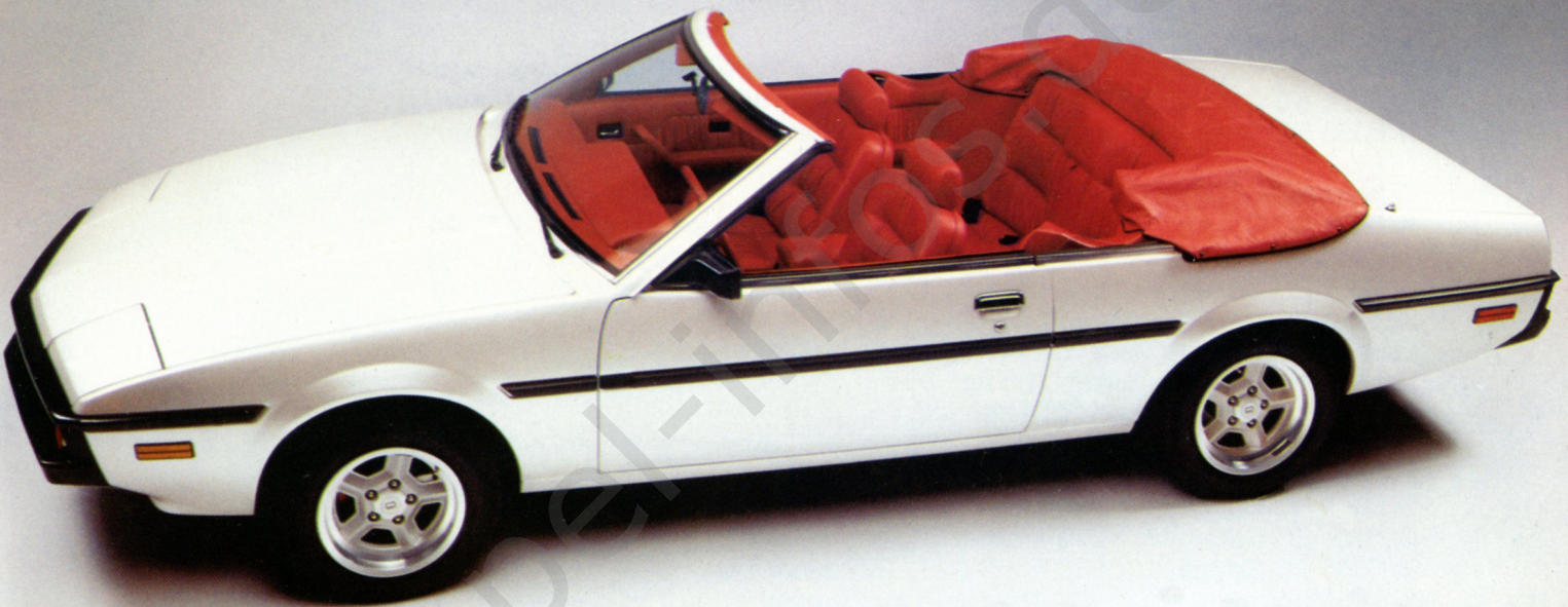
BITTER SC Cabriolet