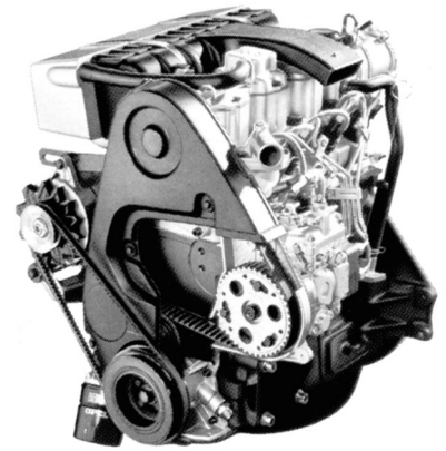
1.6 Diesel-OHC-Motor. 40 kW (55 PS) bei 4 600 min -1 , Leichtmetallzylinderkopf, obenliegende Nockenwelle, hydraulischer Ventilspielausgleich.

40 kW (55 PS), der ebenfalls als Sonderausstattung erhältlich ist.