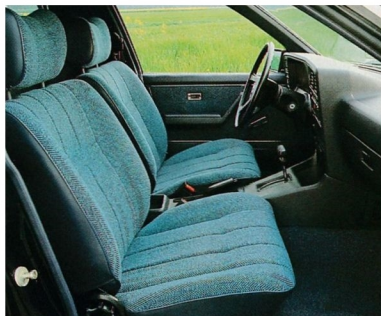
Nach den neuesten Erkenntnissen körpergerecht entwickelte Vordersitze mit ausgezeichnetem Seitenhalt.

Der Innenraum wird serienmäßig mit Gardinentafeln ausgerüstet. Die großen Sargraumscheiben kommen dann zur Geltung, wenn ohne Gardinentafeln im Trauerkondukt gefahren wird.