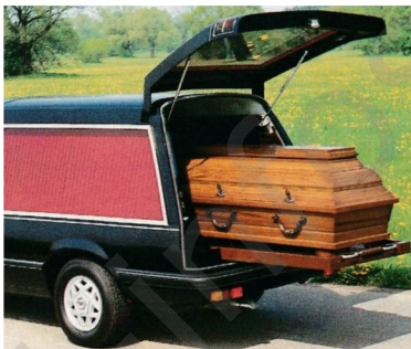
Die serienmäßige Sarg-Schiebebühne erleichtert das Ein- und Ausladen.