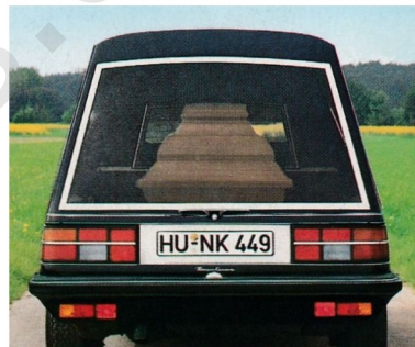
Zusätzliche Schlußleuchten unter dem Stoßfänger sorgen für Sicherheit bei offener Hecktür.