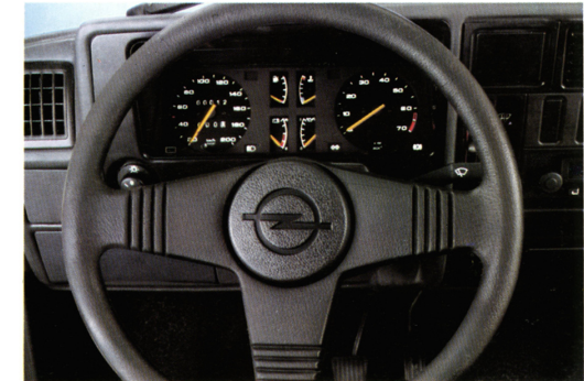
Instrumententafel mit Sportlenkrad