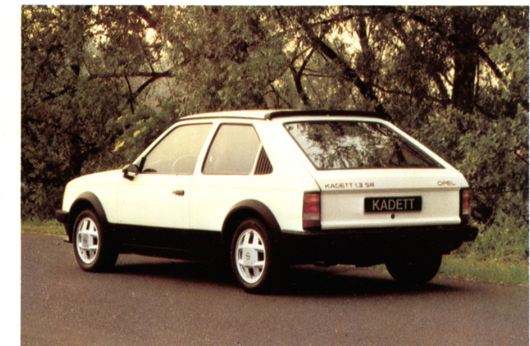
Kadett SR, 3türig