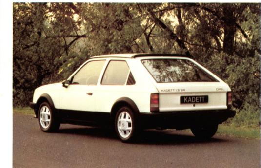
Kadett SR, 3türig